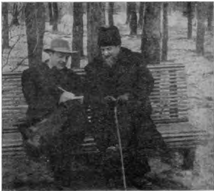
И. В. Курчатов и Л. А. Арцимович. Конец 1959 г.