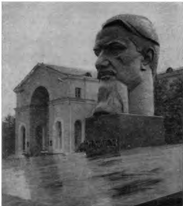
Памятник И. В. Курчатову у Института атомной энергии