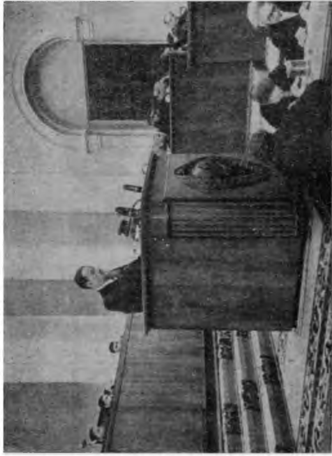
И. В. Курчатов выступает на сессии Верховного Совета СССР, 14 января 1960 г.