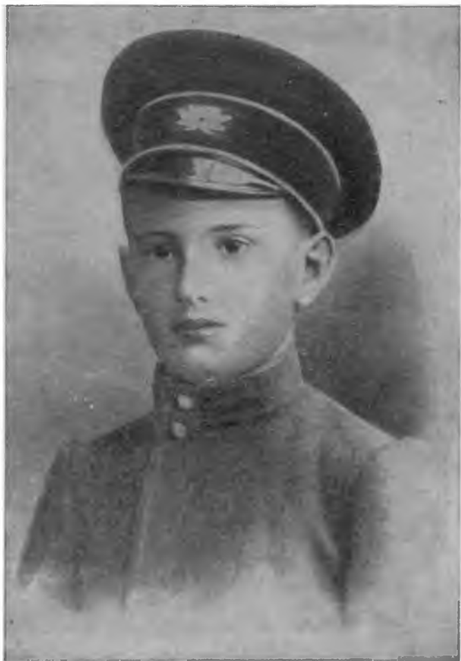
Игорь Курчатов в подготовительном классе Симбирской гимназии. 1911 г.