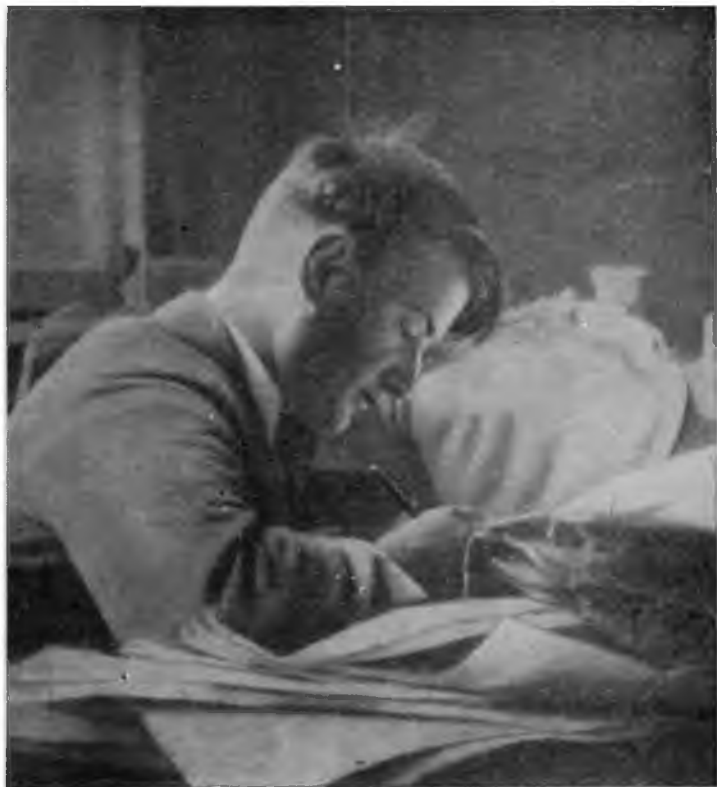
И. В. Курчатов в лаборатории Ленинградского физико-технического института. 1930 г.