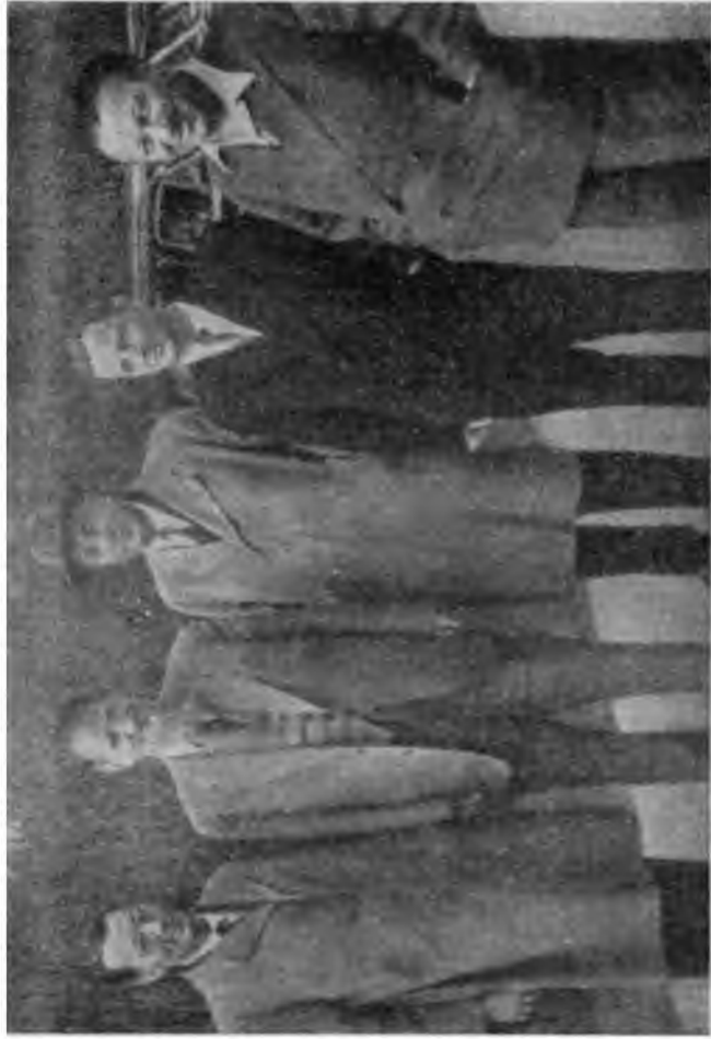
Ф. Жолио-Кюри в Институте атомной энергии (1958 г.). Ф. Жолио-Кюри (слева направо), И. В. Курчатов, Д. В. Скобельцын, Л. А. Арцимович, А. И. Алиханов