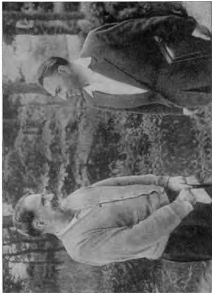
И. В. Курчатов и В. П. Дзелепов. Лето 1959 г.