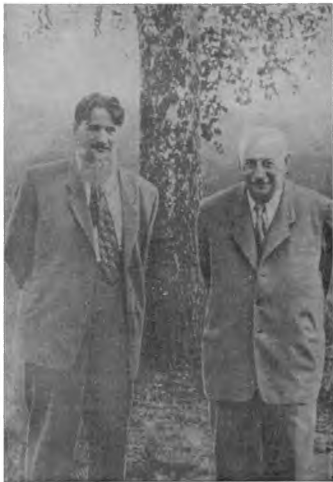
И. В. Курчатов и А. Ф. Иоффе