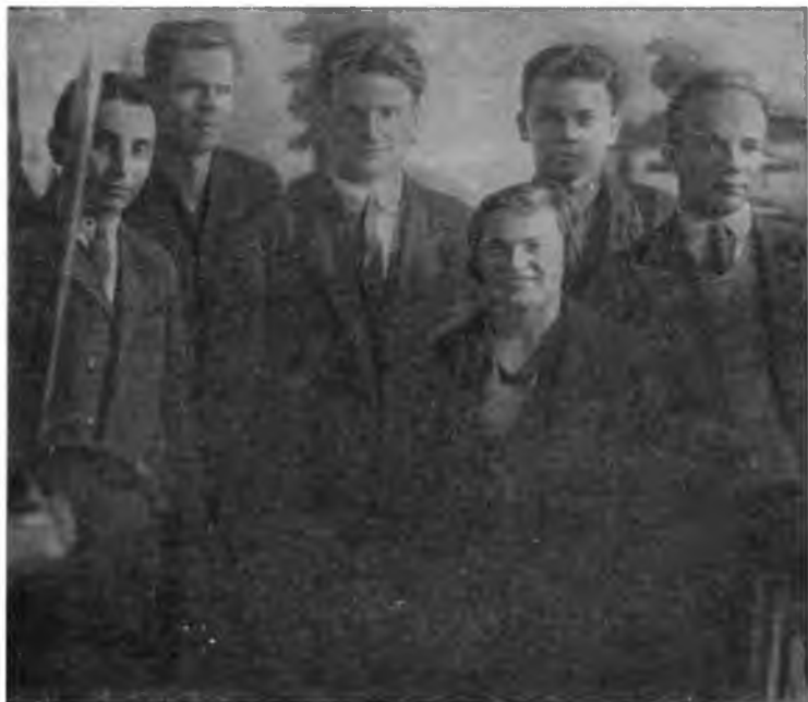
И. В. Курчатов среди сотрудников лаборатории физики ядра ЛФТИ