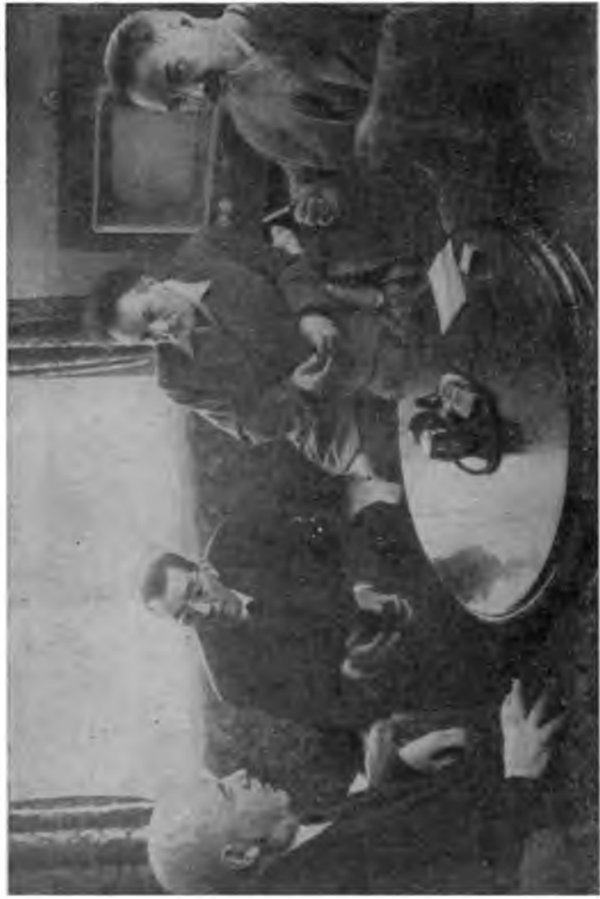
Д. В. Скобелъцън, Ф. Жолио-Кюри, А. И. Алиханов и И. В. Курчатов, 12 мая 1958 г.