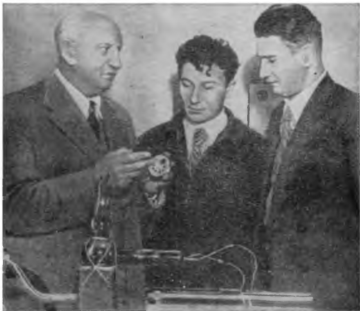
А. Ф. Иоффе, А. И. Алиханов и И. В. Курчатов в Физико-техническом институте. Начало 30-х годов