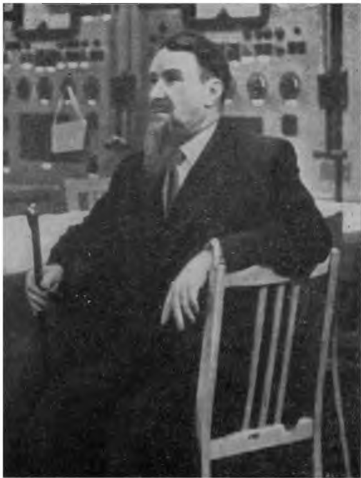
6 февраля 1960 г. Полдень