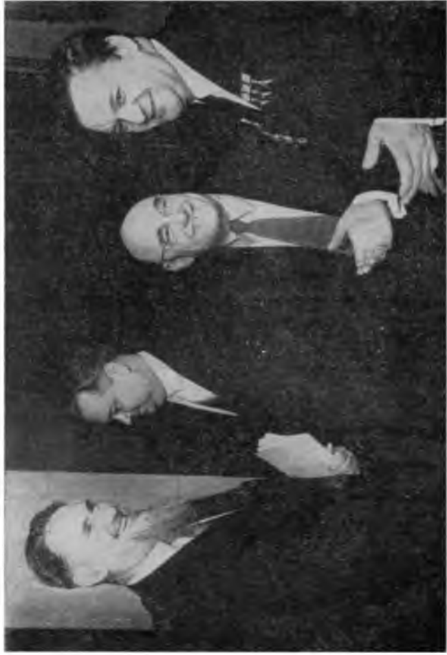
Делегаты XXI съезда КПСС И. В. Курчатов, К. К. Николаев, Б. Л. Ванников и К. И. Щелкин