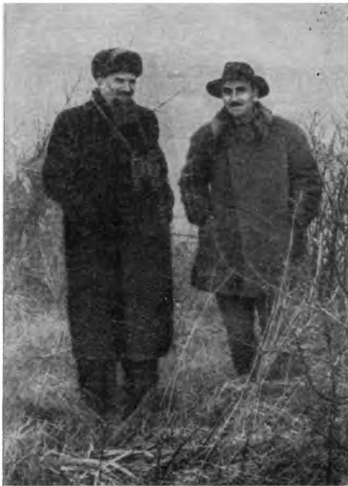
И. В. Курчатов и Н. Н. Семёнов. Осень 1955 г.