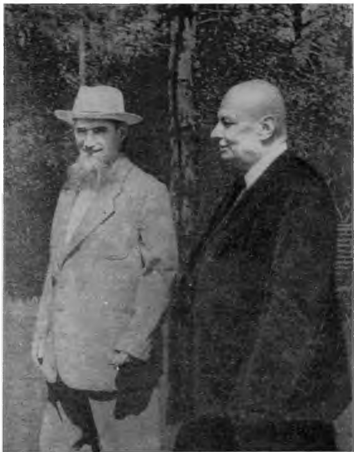
И. В. Курчатов и А. П. Александров. Лето 1954 г.